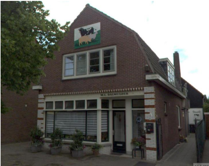
Burgemeester Bletzstraat 16, 16A (orde 1).