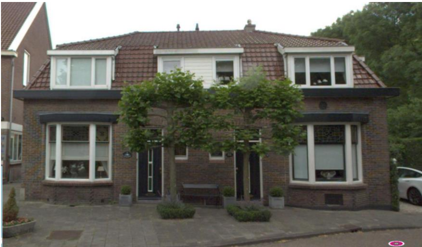
Burgemeester Bletzstraat 70-72 (orde 2) (foto: data.amsterdam.nl, 2024).