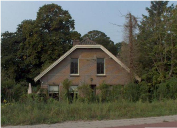
Provincialeweg 1 (orde 2).