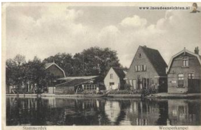
Lange Stammerdijk, 1969.

De mogelijkheid in de fabrieken werk te vinden trok mensen naar het buurtschap. Daarnaast bood ook het waterleidingterrein veel werkgelegenheid. De bewoners vertelden dat hele families daar werk vonden. Wie in Driemond woonde, werkte daar vaak ook. De industrialisering noopte daarom tot uitbreiding van het dorp en in 1922 werd een woonwijkje aan weerszijden van daartoe aangelegde Burgemeester Bletzstraat gebouwd. De lokale woningbouwvereniging 'De Goede Woning' bouwde daar 58 woningwetwoningen. In 1936 zijn er nog 6 woningen in dezelfde straat voor arbeiders bij gebouwd.