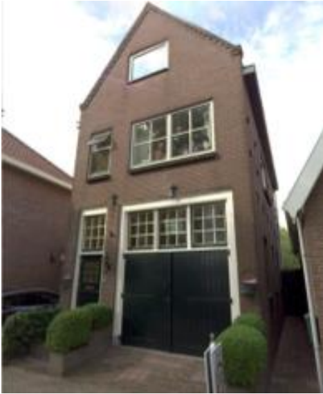
Lange Stammerdijk 17 (orde 2).