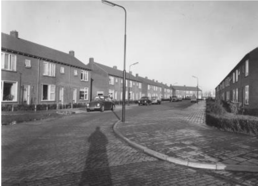
Rijnstraat, nu: Winterstraat.