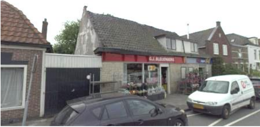
Zandpad (Driemond) 16 – Bleijenberg (voormalige buurtsuper).