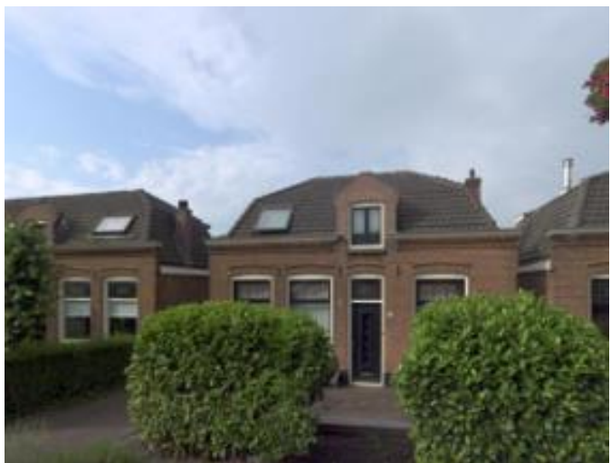
Zandpad 38 (orde 2).