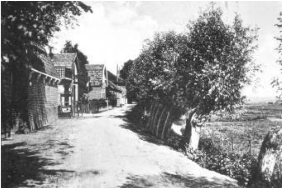
Lange Stammerdijk.