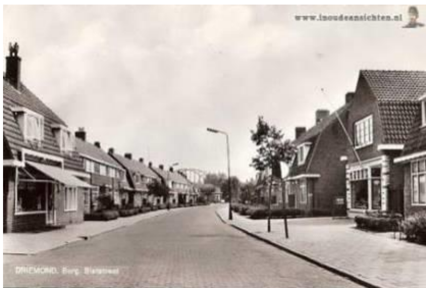
Burgemeester Bletzstraat in 1969 (bron foto onduidelijk).

De mogelijkheid in de fabrieken werk te vinden trok mensen naar het buurtschap. Daarnaast bood ook het waterleidingterrein veel werkgelegenheid. De bewoners vertelden dat hele families daar werk vonden. Wie in Driemond woonde, werkte daar vaak ook. De industrialisering noopte daarom tot uitbreiding van het dorp en in 1922 werd een woonwijkje aan weerszijden van daartoe aangelegde Burgemeester Bletzstraat gebouwd. De lokale woningbouwvereniging 'De Goede Woning' bouwde daar 58 woningwetwoningen. In 1936 zijn er nog 6 woningen in dezelfde straat voor arbeiders bij gebouwd.