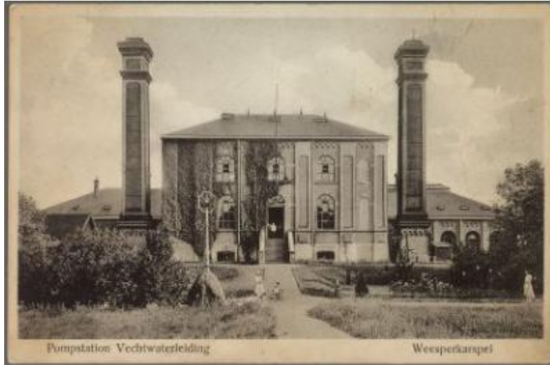
Pompgebouw, 1888 (Beeldbank HKD).

Een andere belangrijke werkgever voor veel dorpingen was de Amsterdamse Waterleiding, een waterleidingbedrijf, dat nog steeds een toegang heeft voorbij Provincialeweg nr. 16. De Het complex werd in 1888 gebouwd om de watervoorziening vanuit de Kennemerduinen te ontlasten en bracht vooral spoelwater voor de industrie naar Amsterdam. Het oorspronkelijk pompgebouw was een ontwerp van J.G. van Niftrik. In 1929 ging het waterleidingbedrijf in Weesperkarspel ook drinkwater leveren, eerst vanuit de Vecht, maar vanaf 1930 uit de Loosdrechtse plassen. Na de oorlog werd het pompsysteem geëlektrificeerd en in 1955-56 werd een nieuw pompgebouw geplaatst. In 1976 zou op dit terrein een nieuw waterzuiveringsstation geopend worden. Van de bouwperiode uit de 19 de eeuw en rond 1950 resteert weinig meer, alleen een rond windtunnelgebouwtje (?) en enkele dienstwoningen.