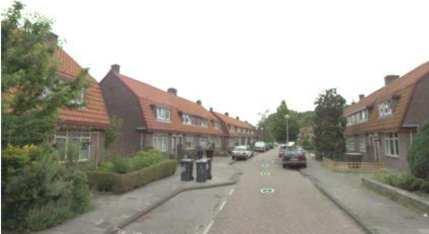
Burgemeester Bletzstraat 3-53, 18-68 (orde 2) (foto: data.amsterdam.nl, 2023).