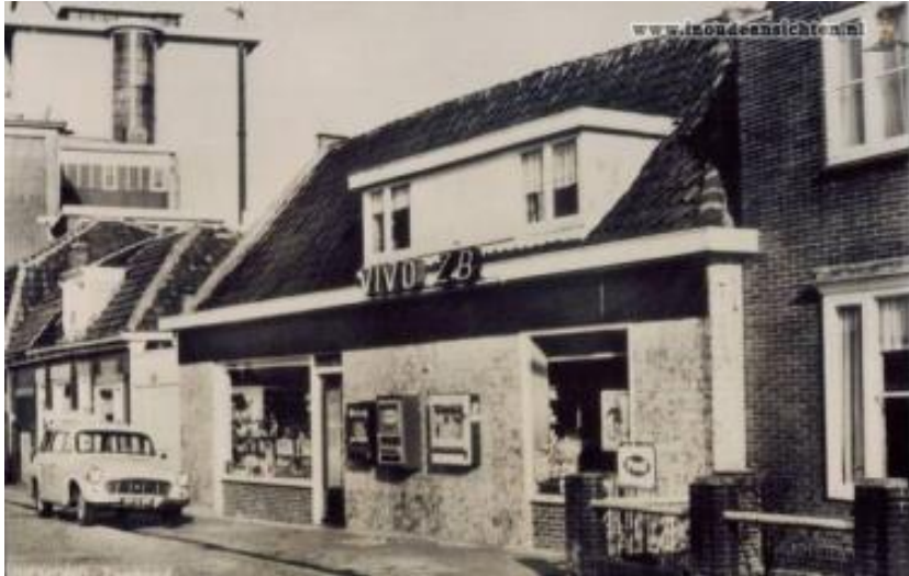
De VIVO, nu: Bleijenberg, Zandpad 16.

De enige levensmiddelenzaak die 2019 nog over was, was de winkel van Bleijenberg aan het Zandpad. Begonnen in 1934 als kruidenierswinkel, moderniseerde de familie de winkel tot een zelfbedieningszaak VIVO in 1951. In de laatste jaren werden er ook biologische en streekeigen producten verkocht. De winkel van Bleijenberg stond sinds ca. 2020 leeg en is 2023 gesloopt.