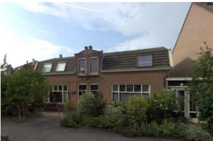
Zandpad (Driemond) 26-28, vermoedelijke vroeger café Kraantje Lek (orde 2).