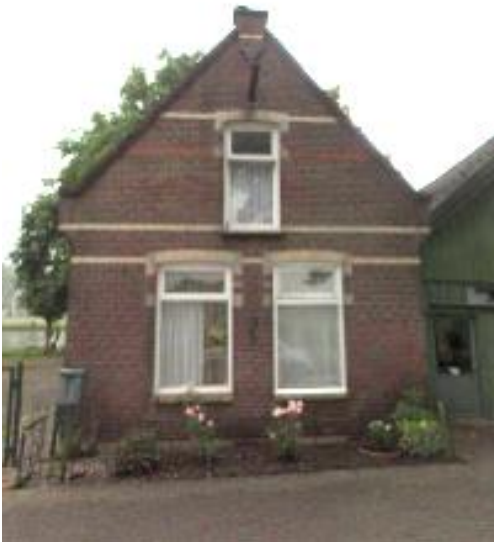
Lange Stammerdijk 65 (orde 2).