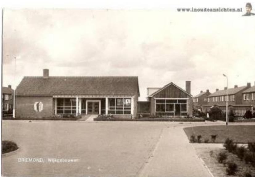
Wijkgebouw Witte Kruis, rond 1950.

Het zwaartepunt van het publieke voorzieningencentrum ligt rond het dorpsplein, waar Jaargetijden en de samenkomsten. In 1961 bouwde de Hervormde Kerk hier Het Kerkwijkgebouw. Aan een andere zijde van het plein kwam er ongeveer in diezelfde tijd een wijkgebouw van het Witte Kruis.