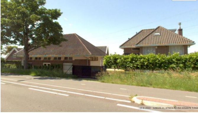
Provincialeweg 13-15 (orde 2).