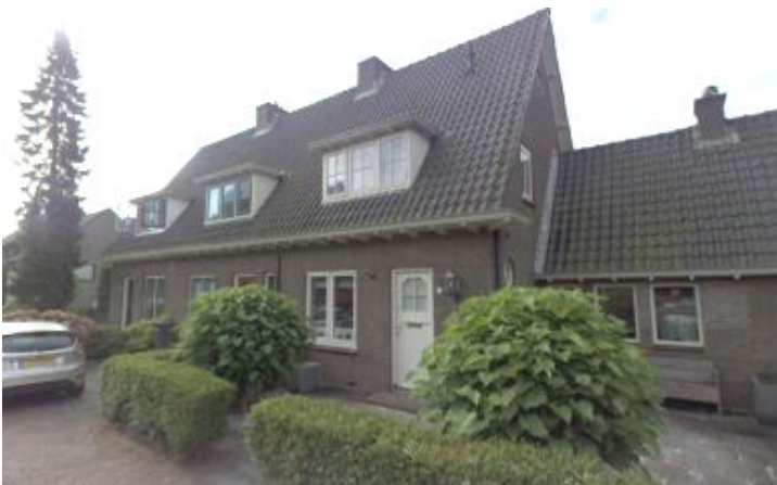
Sluispad 1, 2, 3 (orde 2).