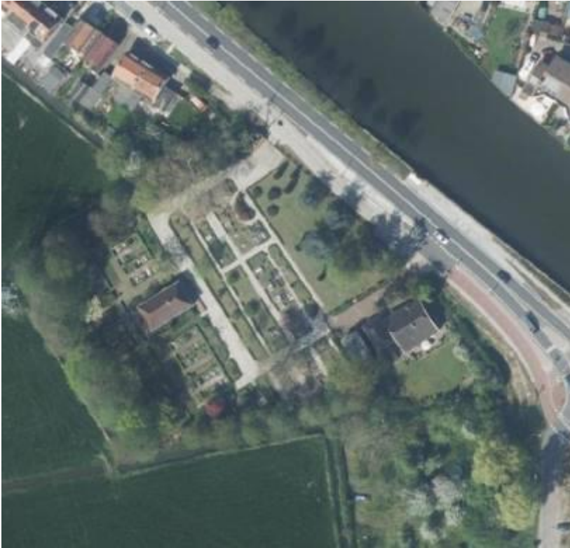
Begraafplaats Driemond.