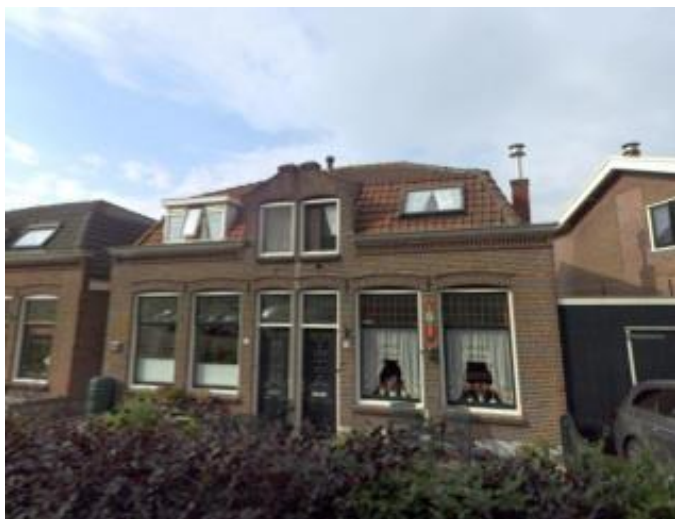
Zandpad 30-32 (orde 2).