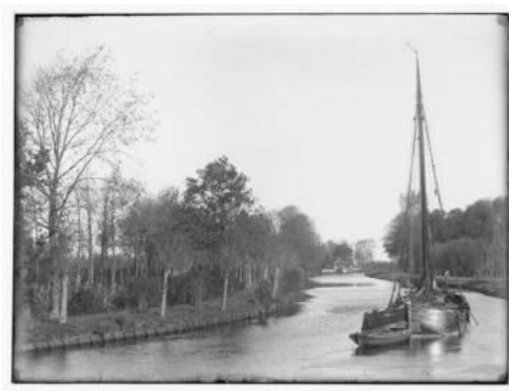
Het Gein ter hoogte van Schoonoord links, 1890 (Beeldbank HKD).