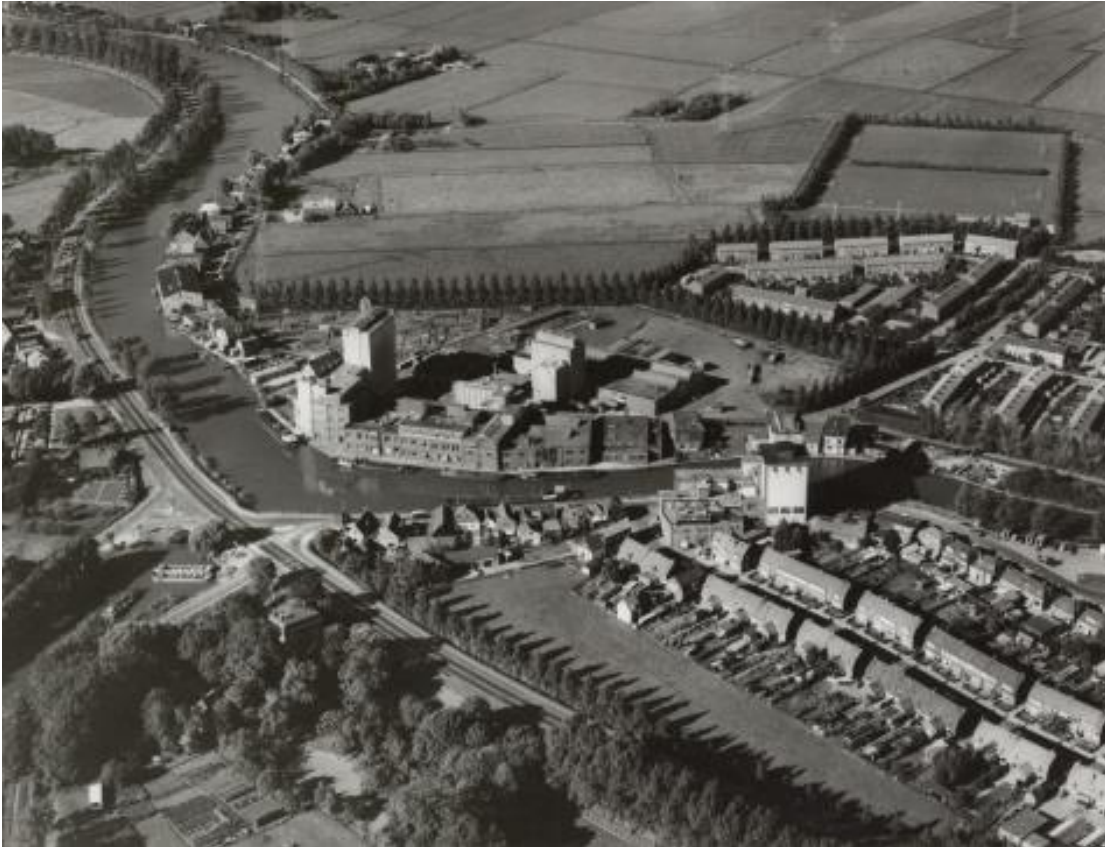
Luchtfoto uit 1971: duidelijk is de Sluis NV aan de Lang Stammerdijk te zien en de fabriek van Otten Schuin daartegenover.

De omwonenden waren niet zo blij met deze fabriek. Vooral 's maandags niet, dit in verband met het stoken van de fabriek; het roet sloeg namelijk neer op het wasgoed. In Boerderij Vredenhof aan het Gein was het kantoor van de fabriek in gevestigd. Deze boerderij is in de jaren 1996-1997 helemaal opnieuw in de oude stijl herbouwd, nadat het in een strenge winternacht volledig was afgebrand. De boerderij werd gebruikt als laboratorium voor het kweken van de meest geschikte granen.