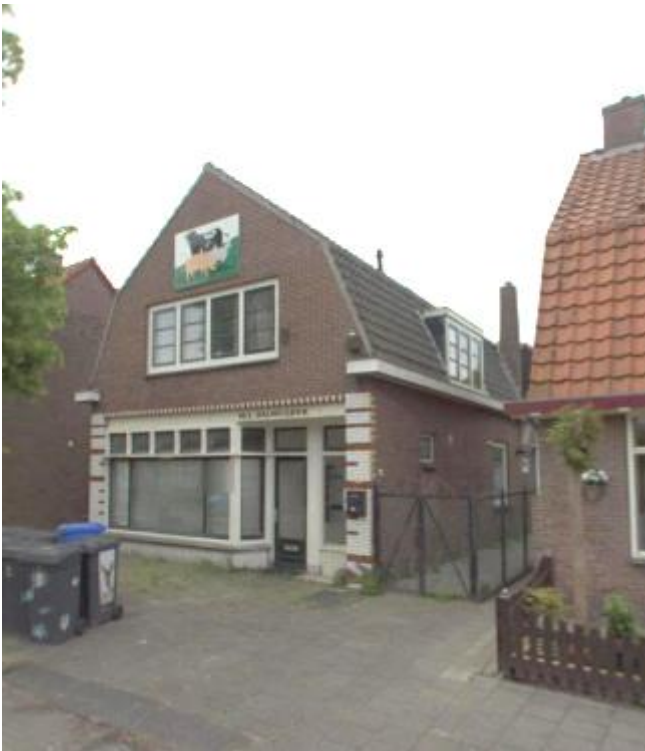
Burgemeester Bletzstraat 16 (voormalige slagerij).