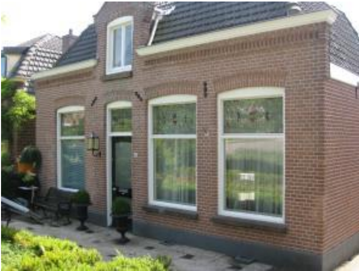
Zandpad 44 (orde 2).