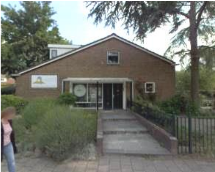
Burgemeester Kasteleinstraat 6 (orde 2).