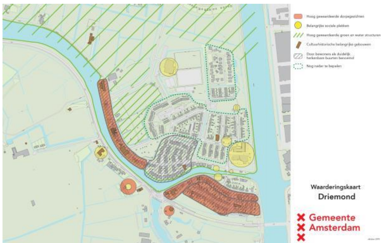
'Waardenkaart' op basis van verhalen van bewoners van Driemond.