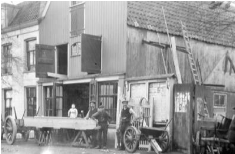
Timmerwerkplaats Egbert de Groot, Zandpad 8-10.

De winkels vervulden een sterke bindende functie in het dorp. Bij slagerij Dalmulder in de Burgemeester Bletzstraat stond een bankje voor de wachtenden waar nieuwtjes uitgewisseld werden. Een zelfde functie had de kruidenier Millenaar voor de gereformeerde dorpsgemeenschap in dezelfde straat, waar naast levensmiddelen ook verf, klompen en laarzen konden worden gekocht. Later voegde de familie een drogisterij toe aan de bestaande winkel.