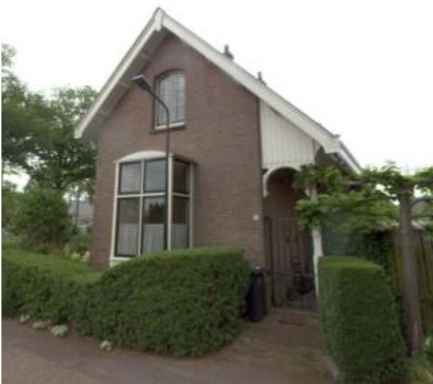
Provincialeweg 16 (orde 1).