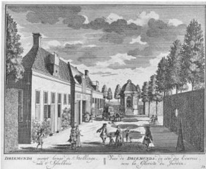
Gravure van Droemond, ca. 1800.