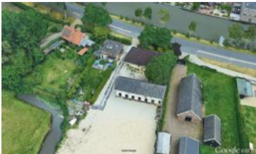
Provincialeweg 13-14 (vroegere openbare school).