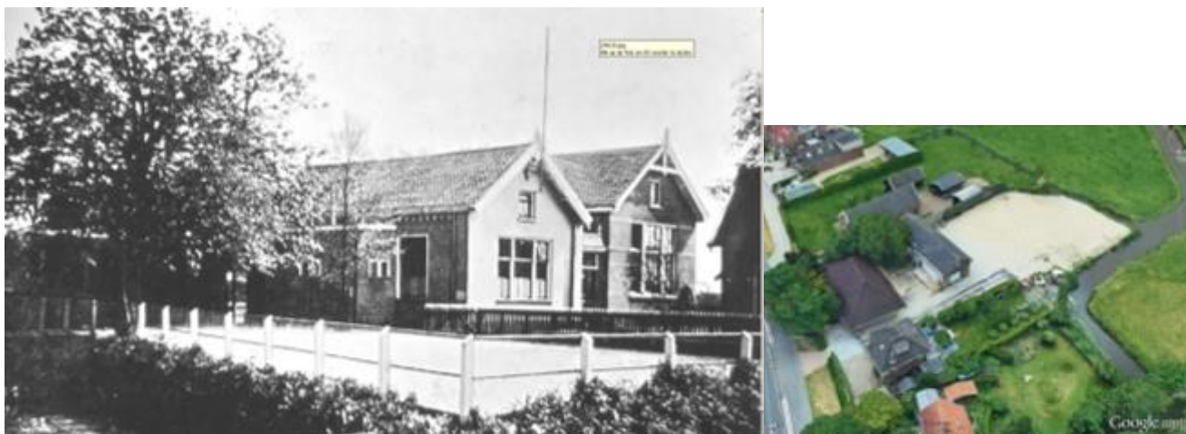
19 de eeuwse openbare school in Weesperkarspel. Vermoedelijk zag de school aan de Provincialeweg er zo uit. (Beeldbank HKD).