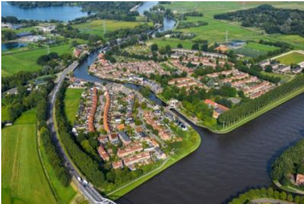
Luchtfoto, Driemond 2015.

Driemond kreeg in 1961 de status van dorp. Oorspronkelijk maakte dit deel uit van de gemeente Weesperkarspel. Toen deze gemeente in 1966 werd opgeheven kwam het dorp onder het bestuur van Amsterdam. De geschiedenis van deze nederzetting aan de Gaasp gaat echter terug tot de 17 de eeuw. De oudste bebouwing is een bakkerij uit 1754 die nu de status heeft van rijksmonument. De aanleiding voor het maken van een cultuurhistorische verkenning van Driemond is het verzoek van stadsdeel Zuidoost, onder wier bestuur het dorp in het verleden viel, om na te gaan of er ook objecten in aanmerking komen voor de status van gemeentelijk monument. 1 In de secundaire literatuur is weinig informatie over het dorp te vinden. Ten tijde van het opstellen van de CHV was er wel een actieve Historische Kring die veel onderzoek deed naar de geschiedenis van het dorp. De kring is eind 2022 opgeheven. Monumenten en Archeologie (MenA) maakt van hun onderzoek dankbaar gebruik, nadat ze samen met leden van de kring een waarderingskaart hebben gemaakt van de dorpsbebouwing.