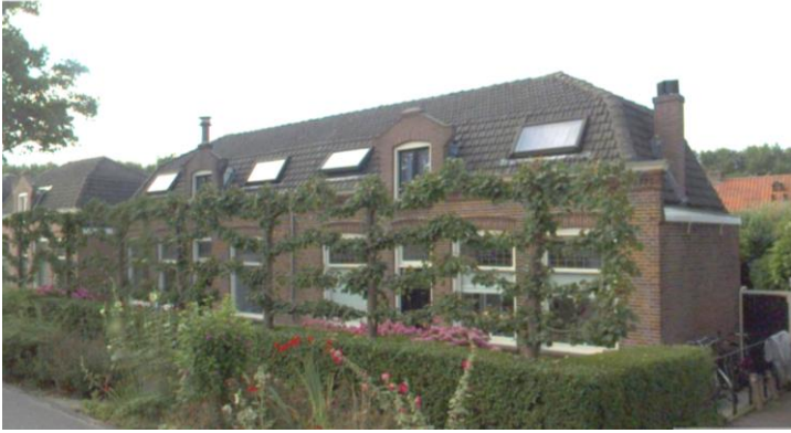
Zandpad 40 – 42 (orde 2) (foto: data.amsterdam.nl, 2023 (foto uit 2018)).