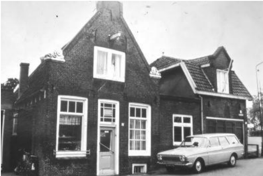
Zandpad 4: Bakker Smit.