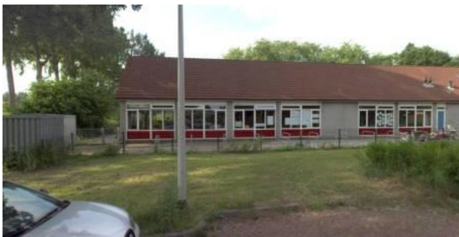
Jaargetijden 4-6 (lagere scholen).