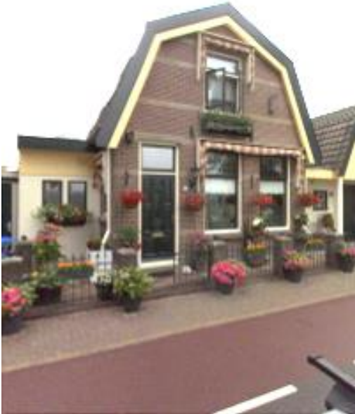
Lange Stammerdijk 79 (orde 2).

Vanuit de opdracht om tot een selectie van monumenten te komen wordt doorgaans begonnen met het onderzoeken van de panden die met een orde 1 of 2 zijn gewaardeerd en nog niet zijn aangewezen.