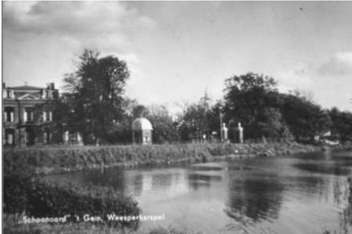
Schoonoord in de jaren zestig.