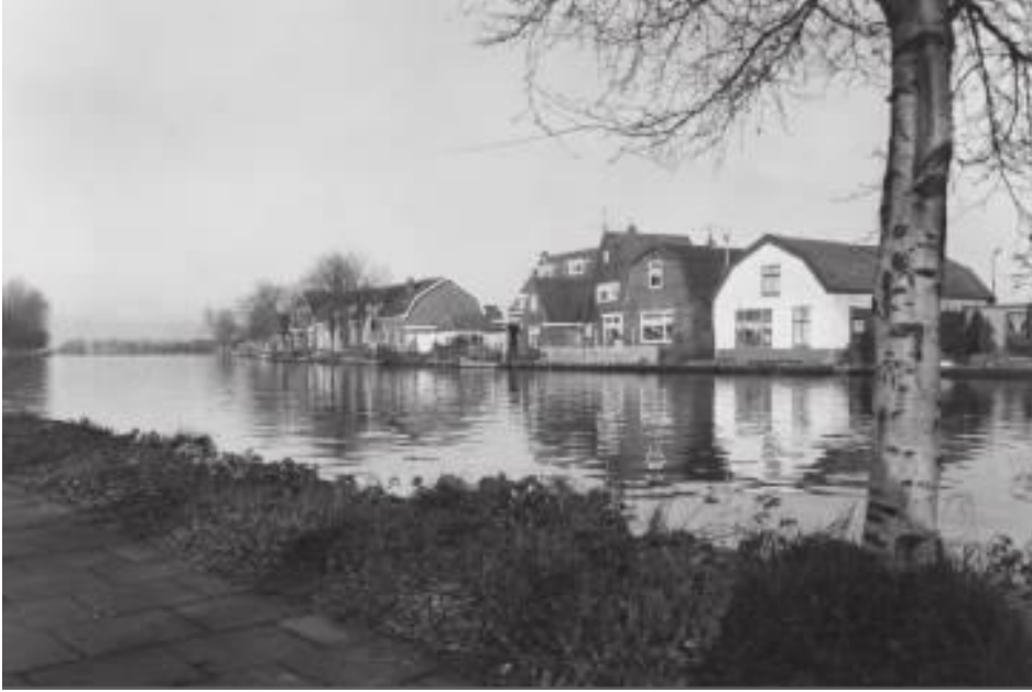
Zicht op bebouwing langs Lange Stammerdijk, 1969.