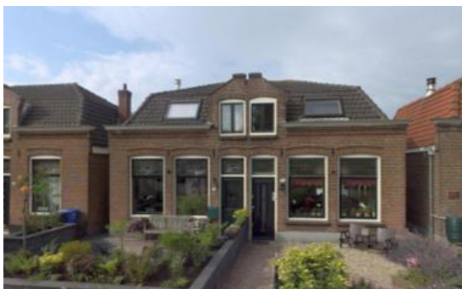
Zandpad 34-36 (orde 2).