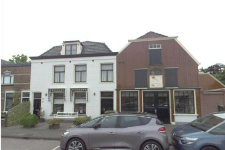
Zandpad (Driemond) 10 (orde 2).