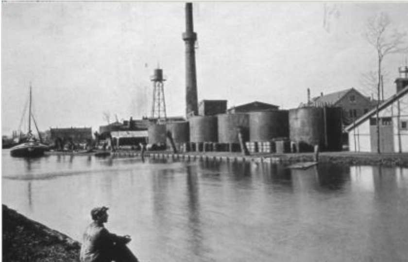
Ammoniakfabriek aan de overzijde van het Amsterdam-Rijnkanaal (bron foto onduidelijk).

Een andere belangrijke werkgever voor veel dorpingen was de Amsterdamse Waterleiding, een waterleidingbedrijf, dat nog steeds een toegang heeft voorbij Provincialeweg nr. 16. De Het complex werd in 1888 gebouwd om de watervoorziening vanuit de Kennemerduinen te ontlasten en bracht vooral spoelwater voor de industrie naar Amsterdam. Het oorspronkelijk pompgebouw was een ontwerp van J.G. van Niftrik. In 1929 ging het waterleidingbedrijf in Weesperkarspel ook drinkwater leveren, eerst vanuit de Vecht, maar vanaf 1930 uit de Loosdrechtse plassen. Na de oorlog werd het pompsysteem geëlektrificeerd en in 1955-56 werd een nieuw pompgebouw geplaatst. In 1976 zou op dit terrein een nieuw waterzuiveringsstation geopend worden. Van de bouwperiode uit de 19 de eeuw en rond 1950 resteert weinig meer, alleen een rond windtunnelgebouwtje (?) en enkele dienstwoningen.