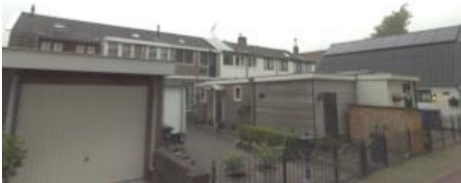
Lange Stammerdijk 51-59 (woningen die vroeger aan het jaagpad lagen).