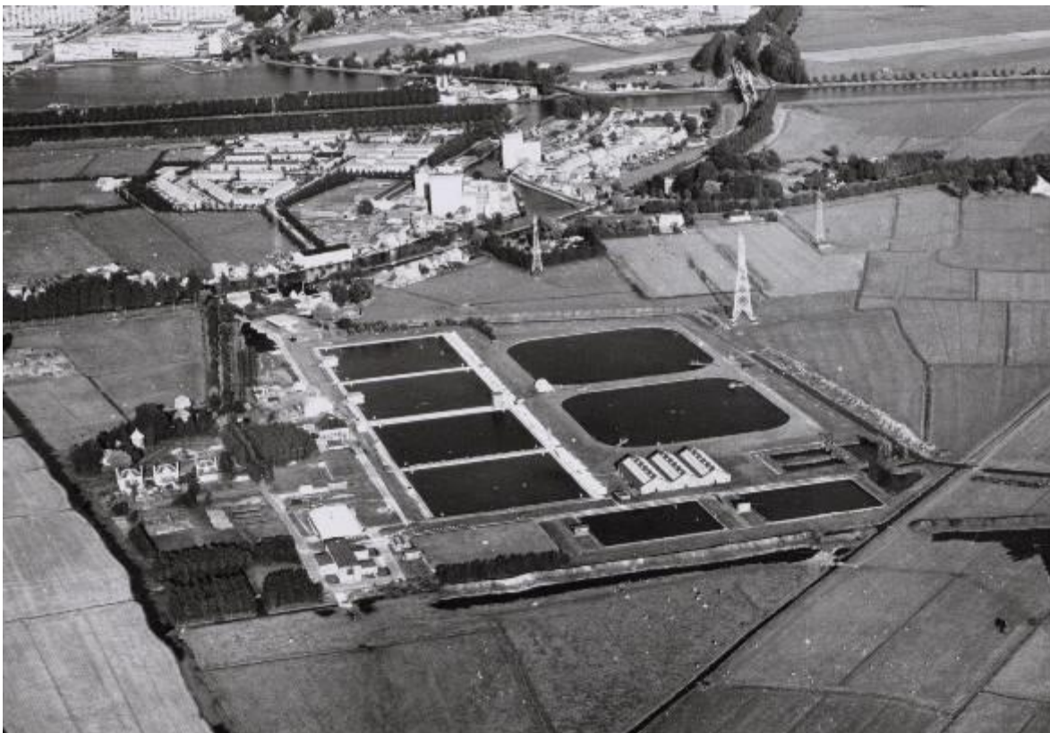
1969: Pompstation Waterleiding Weesperkarspel.