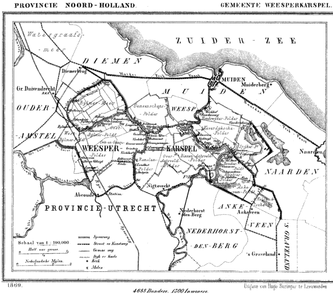
Kaart van Weesperkarspel, 1869 (Beeldbank HKD).

Deze vaart die in 1637 openging, werd ook wel 'Keulse vaart' genoemd, omdat de ringvaart rond de Bijlmerpolder in het verlengde van de Weespertrekkvaart evenals de Gaasp werd verbreed zodat een verkeersroute voor goederen- en passagiersvervoer voor trekschepen naar Keulen ontstond. Het passagiersvervoer startte twee jaar later. Voor de overbrugging van het Gein werd de Geinbrug gebouwd waaraan de nederzetting rond het knooppunt van vaarwegen haar naam ontleende.