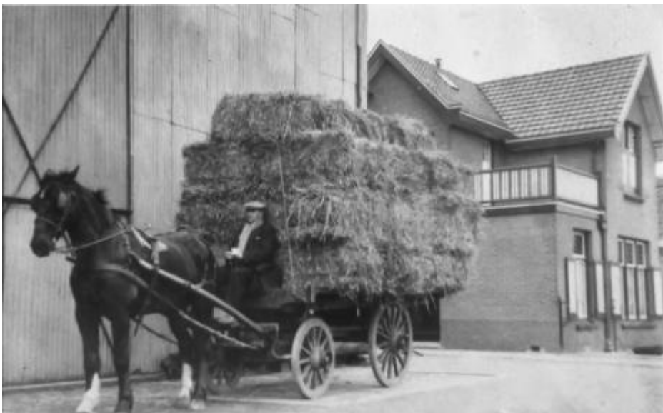
Hooiopslag Niessing, Lange Stammerdijk en woning van Niessing ernaast.

Aan de Lange Stammerdijk en het Zandpad ontstond de eerste lintbebouwing. Door particulieren en ondernemers werden individuele woonhuizen gebouwd. Boerderijen stonden niet alleen aan de rand van de Gemeenschapspolder aan de voet van de dijk of aan de noordkant langs het Zandpad (later: Provinciale weg). Ze stonden en staan ook midden in het gehucht. De bijbehorende landerijen liggen buiten het dorp. Gevoegd bij de winkels in het dorp en de houtbedrijven, garages en andere bedrijvigheid zorgden deze voor een grote diversiteit in typologie en vormgeving van de bebouwing, evenals het contrast in schaalgrootte door de aanwezigheid van grote fabrieksgebouwen.