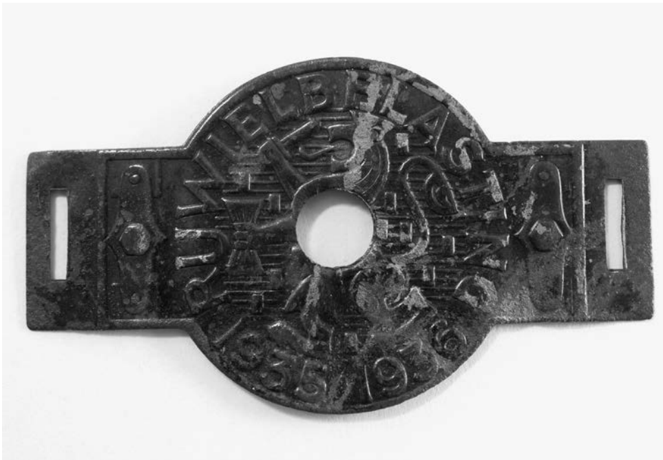
Rijwielplaatje met gat, 1935-1936

zichtbaar. Maar vergis u niet. Het enorme gebruik van de sociale media, veel anoniemer en kwaadaardiger dan de ouderwetse roddel, kan grote schade aanrichten en mensen wegzetten en ontmenselijken, met alle gevolgen van dien. Belangrijk dus om mensen, hoe ze er ook uitzien, zoveel mogelijk 'lijfelijk' te ontmoeten. Een praatje met de burend, bezoek