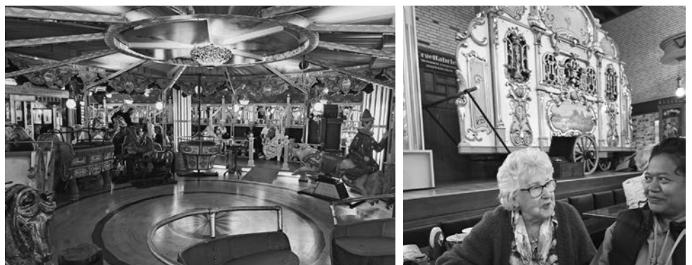
De busreis van de Seniorensoos op 2 juni. Koffie en gebak bij Restaurant de Engel en een bezoek aan museum Soet en vermaeck in Hilvarenbeek.