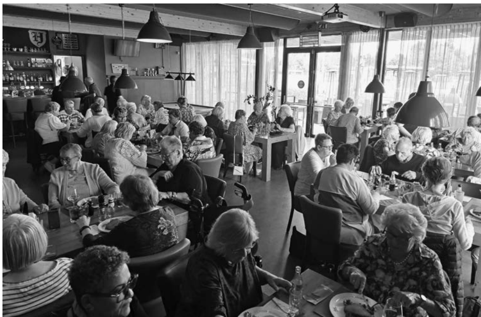
De feestelijke afsluiting van de busreis met een smakelijk drie-gangen menu.

vervolg > winnen. Raad eens, wie er met een teddybeer naar huis ging? Wat een toeval!