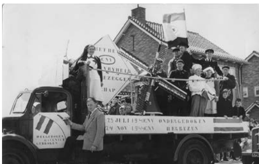
De terugkeer van de CNV, 1950