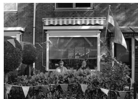
Feestelijk vlagvertoon, koningsdag 2020