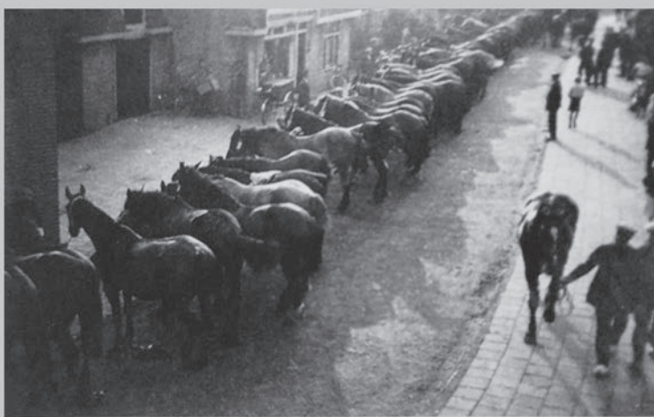
De boeren met hun paarden moesten zich melden in de burgemeester Bletzstraat. Foto's omstreeks 1939.

Voor meer historische stukjes kijk op historischekringdriemond.nl