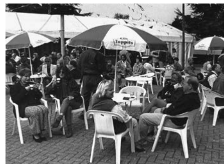
Koninginnedag 1990, tijd voor gepaste ontspanning.