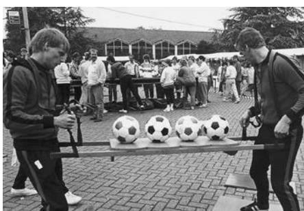
Koninginnedag 1990, voetbal-looprace. ik geef het je te doen!