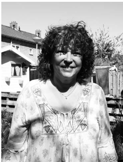
Elles le Maitre-de Clerk

Dit spreekuur is tegelijk met het buurtteam dat elke twee weken ook op don-