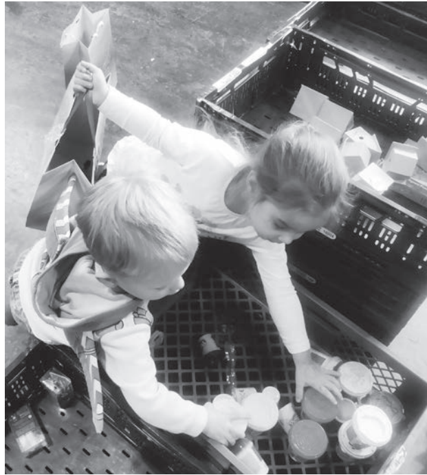
Jonge Driemonders helpen met inpakken van de pakketten

Wanneer deze dorpskrant uitkomt is het bijna 'blue monday'. Januari is de tijd van goede voornemens. De tijd om slechte eigenschappen te minderen/stoppen en te beginnen of door te gaan met de goede dingen. Meer bewegen, minder snoepen maar ook bijvoorbeeld belangrijke/goede dingen doen voor anderen. 'Blue monday' is de dag die bekend staat als de dag om weer te stoppen met goede voornemens omdat deze niet haalbaar lijken en je 'blue'/depressief te voelen omdat het niet gelukt is. Misschien is het dan juist het moment om goed te kijken wat is wel haalbaar?